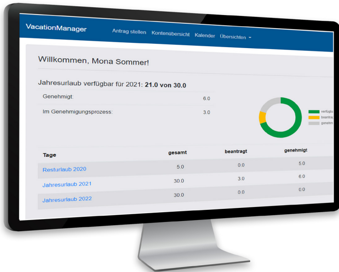
Startbildschirm des Vacation Managers mit Urlaubsübersicht

Der Vacation Manager ging wie geplant zum Neujahr 2023 live. Nach einer kurzen Eingewöhnungsphase nutzt das Schulpersonal von Semper das Tool heute bereits routiniert und ist zufrieden mit Bedienung und Funktionalität. Dank der Bereitstellung des Tools als Software as a Service entfällt der Aufwand, den Semper vormals mit der eigenentwickelten Lösung hatte. Auch zukünftig steht TIMETOACT dem Bildungsträger bei Fragen und Problemen zum Vacation Manager im Rahmen des Support-Vertrags zur Verfügung.